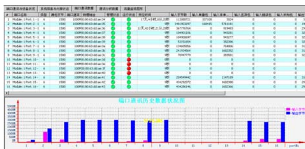
图 3 交换机端口数据界面